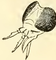
Cabeza de Ac. boliviensis , vista de \frac{3}{4} , aumentada.

Gracilis ut Diachlorus, elongata, ochraceo-testacea, sed antennis apice, callis frontali et verticali, et tarsi anticis nigro-piceis; thorace fusco, griseo-4-lineato, triangulo antealari et abdomine